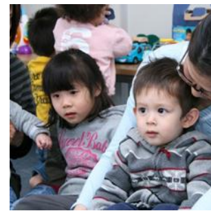
(MY Play Timeの様子)

☆開放時間:毎週火曜日午前10時から正午まで ☆対象年齢:0歳から就学前のお子さま